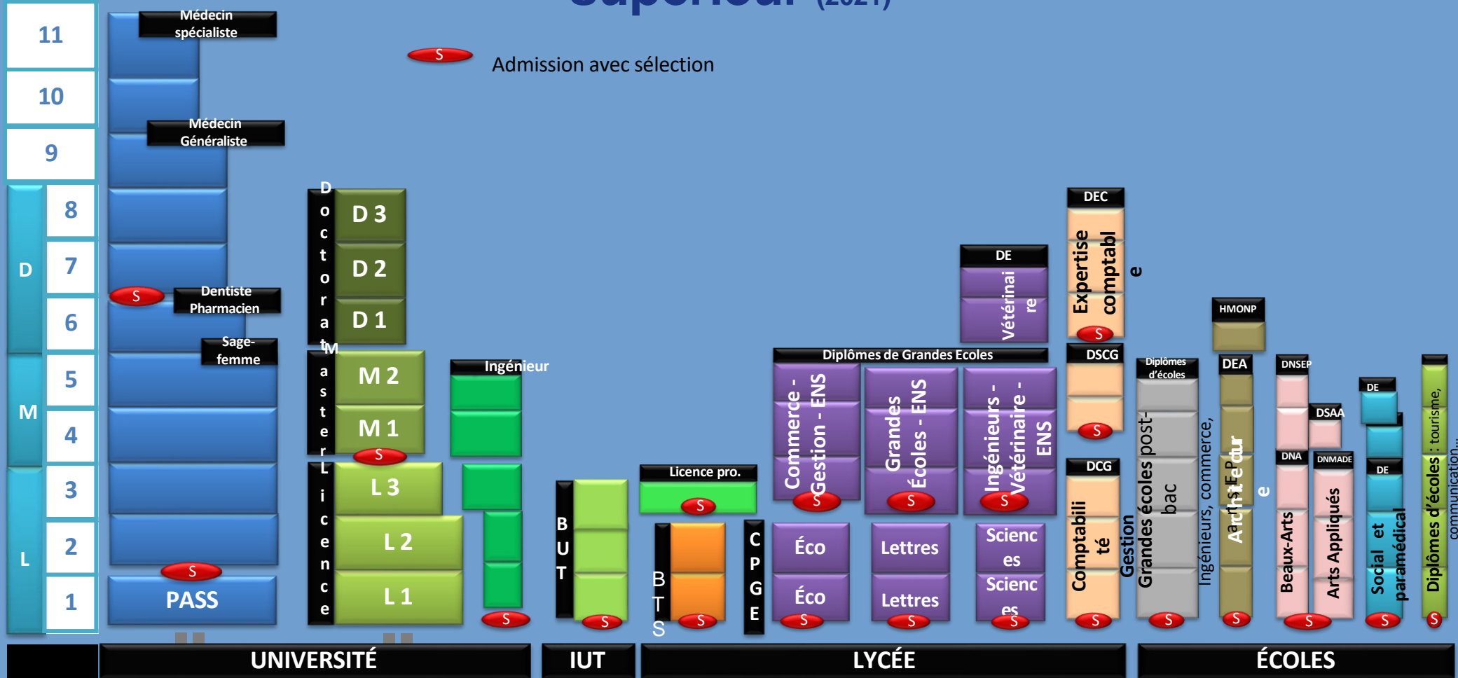
Schéma de l'enseignement supérieur (2021)